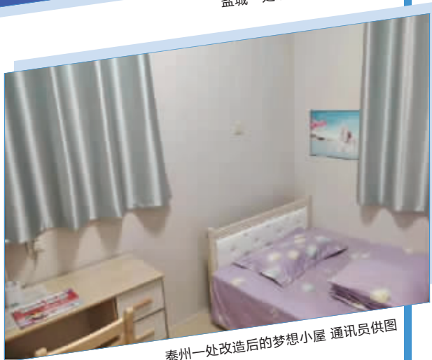
泰州一处改造后的梦想小屋