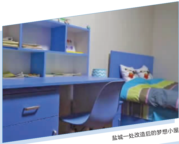
盐城一处改造后的梦想小屋