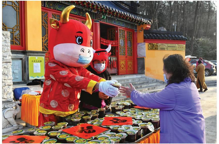
南京玄奘寺为社区和养老院定制腊八粥

昨天大寒,也是农历腊月初八,腊八节。俗话说,腊八遇大寒,万事“粥”全。大寒和腊八同一天,巧不巧?巧!中科院紫金山天文台科普部主任张旸告诉现代快报记者,大寒和腊八相逢,大体上19年一遇。上一次是2002年1月20日,下一次则是2032年的1月20日。