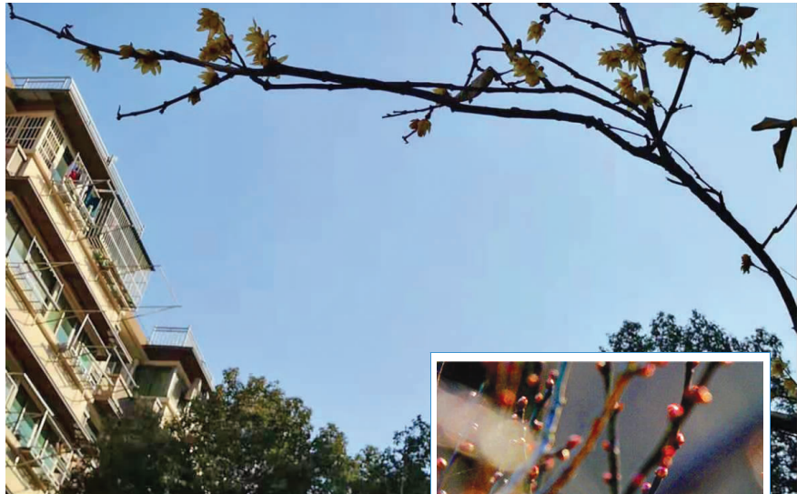
这两天南京温暖如春,冬花陆续开放

1月20日,迎来大寒。但昨日白天,依旧温暖如春。不过这样的好天气很快将告一段落,受西南暖湿气流增强影响,20日夜里起,雨雨雨模式就将替代晴暖干燥,全省范围内的降温也已安排上了。