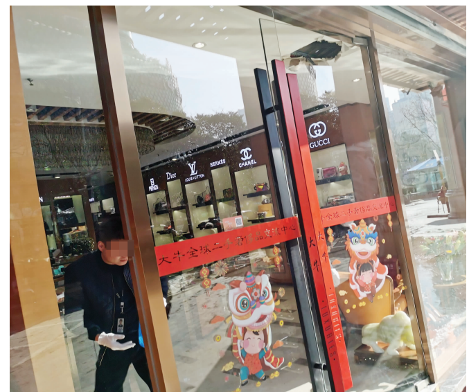
事发现场

快报讯(记者 谢喜卓 季雨 顾元森)有消息称,1月19日南京发生一起盗窃案,一家知名二手奢侈品店被盗68块高档手表,还有珠宝、包等,据称总价值1300多万。1月20日上午,现代快报记者来到位于南京石鼓路的这家店,某大门紧闭,附近商户说:“昨天上午我们来上班的时候,警察把店围起来了,好像里面东西被偷了。”现代快报记者从南京警方了解到,确有此事。