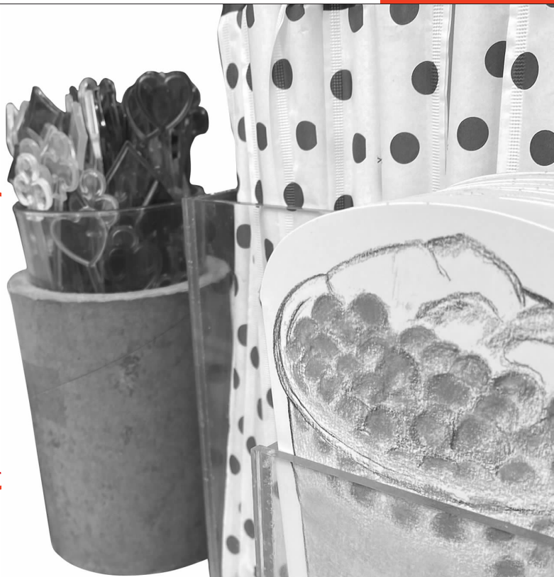
某奶茶店内,仍在用塑料叉

2021年1月1日,“禁塑令”开始生效。但有消费者发现,很多商家为了方便买奶茶类饮品的顾客,仍附送塑料叉用来划破塑封。生产企业也表示,塑料叉大多供给奶茶店。