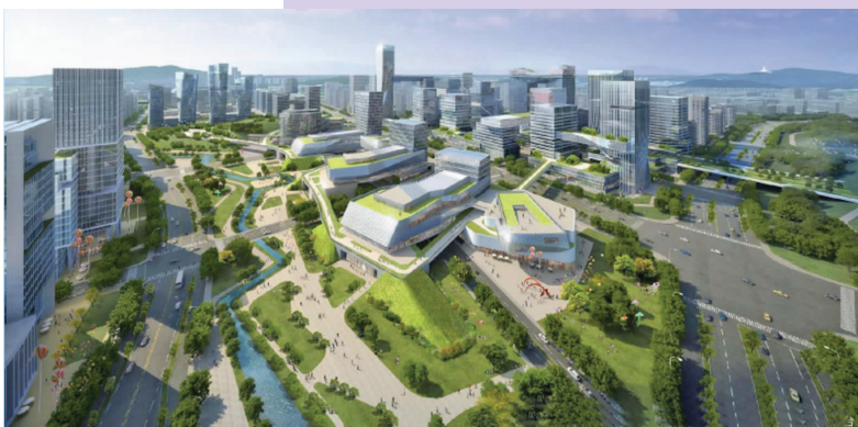
东流中心地段效果图