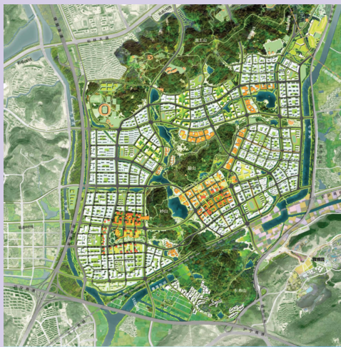
总平面图