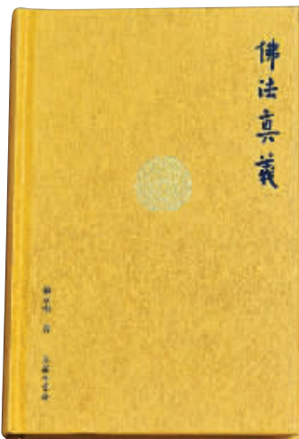
赖永海的著作《佛法真义》