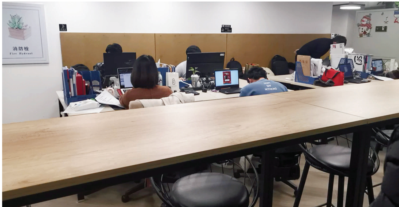
联合办公空间的共享工位