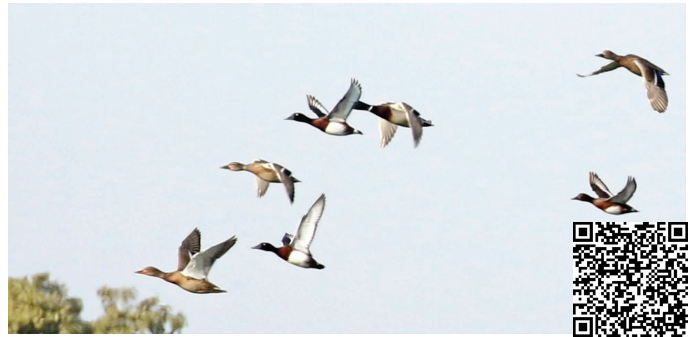
尊贵的客人 扫码看视频

快报讯(记者 卢河燕)1月14日,现代快报记者从江苏省林业局获悉,张家港市长江省级重要湿地的观鸟机构——苏州湿地自然学校的调查员1月10日观测到5只青头潜鸭栖息在一片芦苇湿地中。这是“极危”青头潜鸭在张家港市乃至全省的首次发现。青头潜鸭主要繁殖于我国东