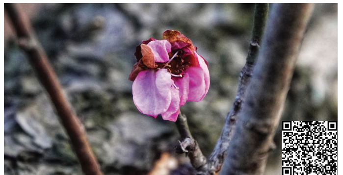
凌寒独自开 扫码看视频

快报讯(记者 张然)墙角数枝梅,凌寒独自开。眼下虽是寒冬,但是在明孝陵梅花山博爱阁附近,已有梅花抢先吐蕊,惊艳绽放。而此时,景区里的蜡梅也进入了最佳观赏期,暗香浮动,上演着“二梅争春”的独特美景。