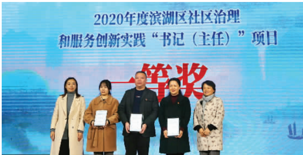
2020年度无锡市滨湖区社区治理和服务创新实践“书记(主任)”项目评审大会颁奖现场。