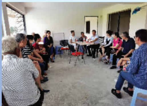
蠡园街道西园社区的“公共空间营造会议”