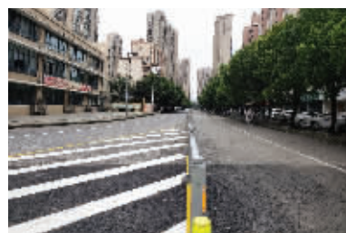
河埭街道蠡桥社区住友路道路整治前后对比