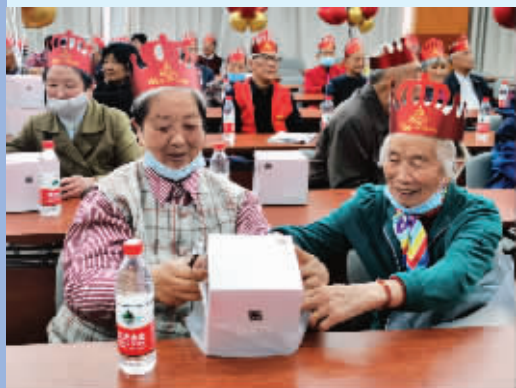
湖景社区为居民办集体生日会