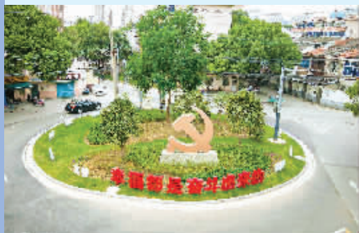
河埭街道蠡桥社区增设住友路环岛党建元素标识

在评审大会现场,滨湖区民政局局长宋晓裕在致辞中表示,2020年是极不平凡的一年,这一年,滨湖社区干部,吃苦耐劳、勇于创新,积极应对新冠肺炎疫情防控、人口普查等重大挑战,夺取了疫情防控与治理创新的双胜利,这既是社区治理的成效所在,也是社区工作的价值所在。