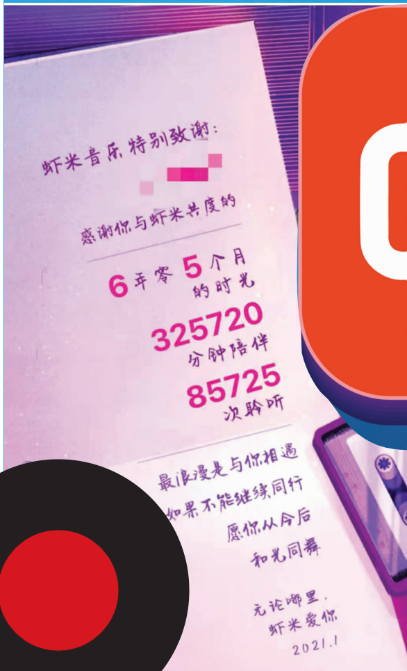
粉丝晒出和虾米的故事