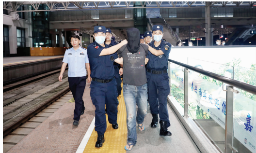
嫌疑人落网后被押回

2004年,苏州市吴中区发生一起命案,一名年轻女子被害身亡。警方通过调查发现,与其同居的男友在案发后不知去向,有重大作案嫌疑。原来,受害人男友在杀人后,与父亲一起逃往云南大理的深山中。16年间,嫌疑人连电话卡都没有办过,每周的娱乐就是到山腰的一家加油站,蹭网下载电影打发时间。由于长期在封闭环境中生活且少与人交流,落网时嫌疑人几乎已失去了语言能力。