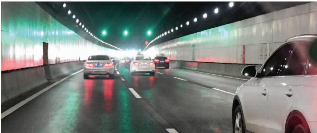
通行政策调整后,应天大街长江隧道出口可变车道将延长至1.6公里

南京江心洲长江大桥(长江五桥)即将通车,12月21日,现代快报记者从南京长江隧道有限公司获悉,应天大街长江隧道通行政策将相应调整,全面禁止货车通行。同时,为响应市民需求,提高总体通行效率,隧道内将再次增加可变道区域,并对各类客车行驶车道进行具体规定,大型客车须靠右行驶。