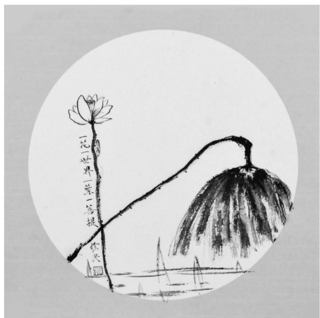
《一花世界 一叶菩提》33×33cm