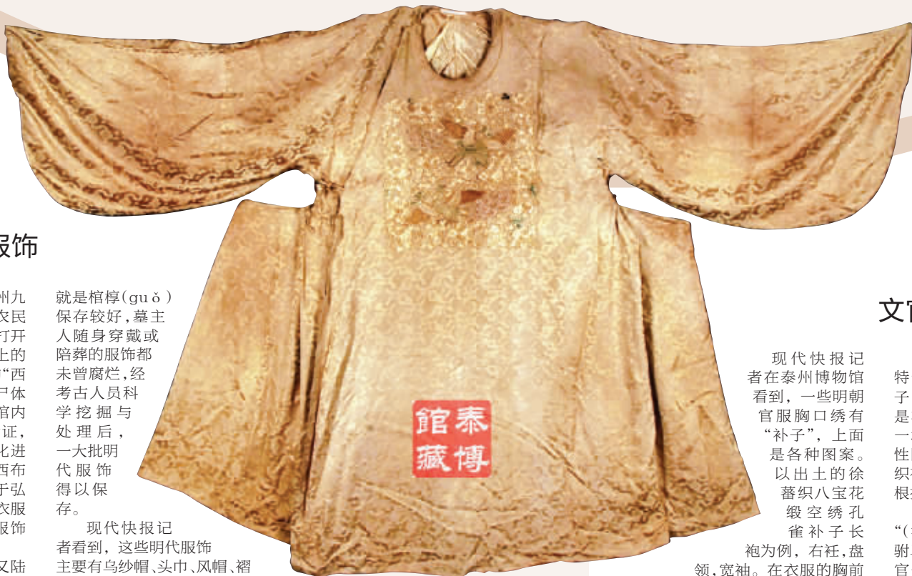
徐蕃织八宝花缎空绣孔雀补子长袍

“其实不然，明朝衣服的样子与朱元璋有关。”郭正军说，明朝是推翻元朝后建立的新王朝，明朝开国不久，朱元璋就下令禁穿胡服，恢复汉人衣冠。官吏戴乌纱帽，穿圆领袍，宽长大衣，衣领也从宋代的对领变成圆领。“明代服饰最突出的特点，是前襟的纽扣代替了几千年来的带结。”