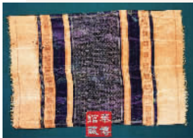
徐蕃墓出土的明代花绫巾