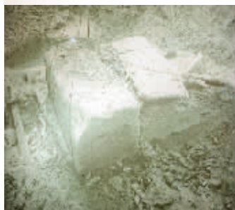
抢救性挖掘现场