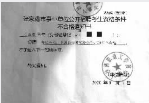
不合格通知书显示因专业不符政审不合格,不予进入下一环节