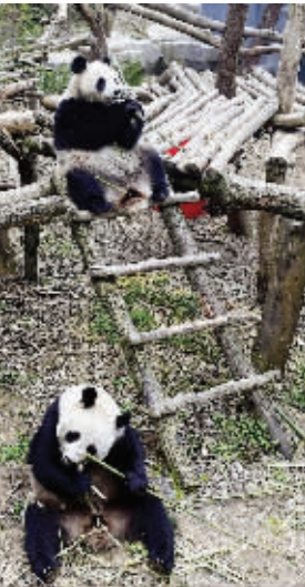
南京红山森林动物园里的大熊猫