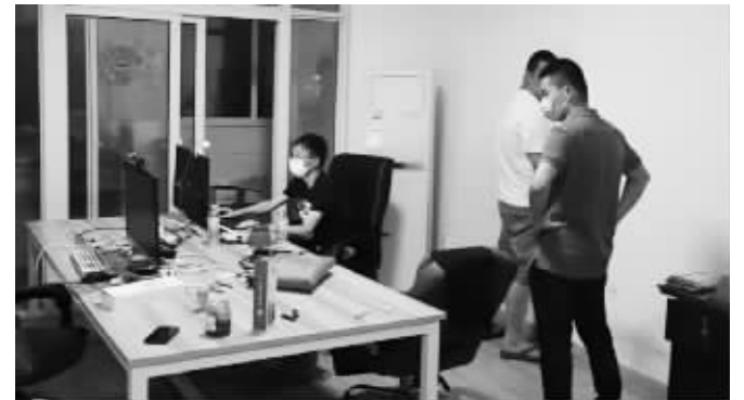
抓捕现场

快报讯(通讯员 苏锦安 记者 严君臣)12月15日，南通市公安局对外通报，在“净网2020”专项行动中，成功破获一起特大破坏计算机信息系统案，抓获犯罪嫌疑人7名，斩断一条网络黑灰产业链。现代快报记者了解到，该犯罪团伙租用境外服务器搭建网络攻击平台，并通过发展代理和出售会员账号的方式牟利。去年下半年以来，共先后向5000多个网站实施过流量攻击，非法获利100余万元。