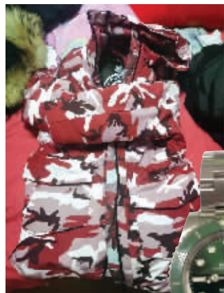
被盗窃物品里有手表、羽绒服等

近日,江苏张家港警方抓获一名涉嫌盗窃的男子。作为快递中转站的运输司机,男子监守自盗,短短半个月盗走23件快递,总价值超过8万元,盗窃物品包括手表、羽绒服、大闸蟹、医疗设备等。