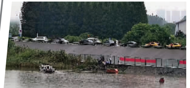
白色快艇停在江边,岸上的人正忙着搬运物资