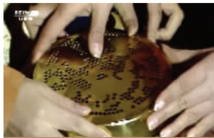
央视网电视剧《红楼梦》1987年版截图