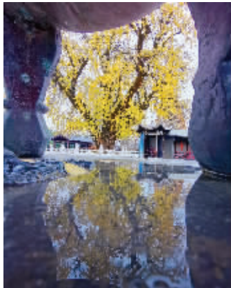
银杏再迎颜值巅峰

据传，这三棵银杏为梁昭明太子萧统(501-531年)来此读书时栽植。银杏前不远处有一处灰白石碑，上面写着“南京市文物保护单位 惠济寺银杏”“南京市人民政府 一九八四年四月一日立”。