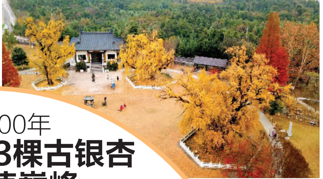
3棵古银杏从左到右围绕着延寿宝殿