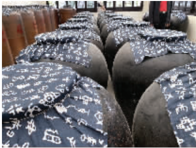
中国镇江醋文化博物馆