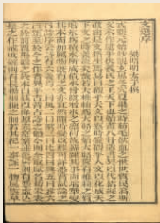
(南朝·梁)萧统《文选》书影 同治八年刻本(镇江市图书馆藏)