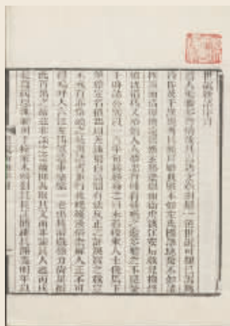
(南朝·宋)刘义庆《世说新语》书影 光绪十七年刻本(镇江市图书馆藏)