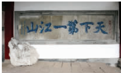
北固山“天下第一江山”石刻

随着时间推移，不仅刘勰的《文心雕龙》、昭明太子的《文选》在镇江诞生，苏轼、欧阳修、米芾、陆游，都在镇江留下过千古名篇。