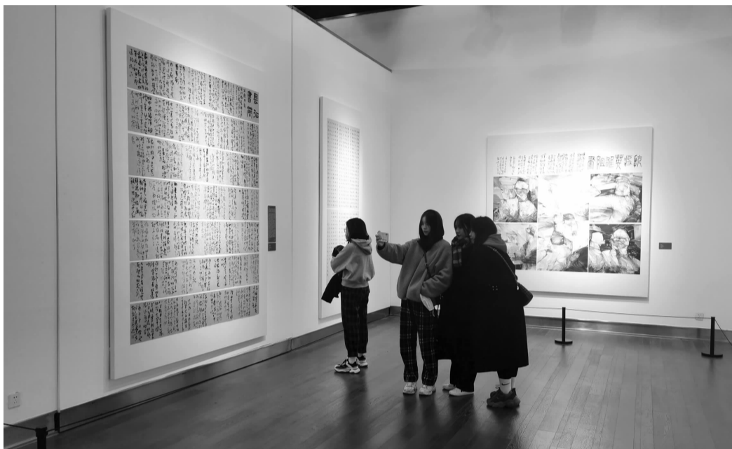
南京书画院青年书画院主题创作汇报展现场