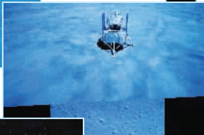
▶嫦娥五号落月瞬间