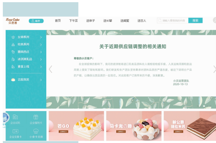
在贝思客官网定位南京,首页醒目的供应链调整通知