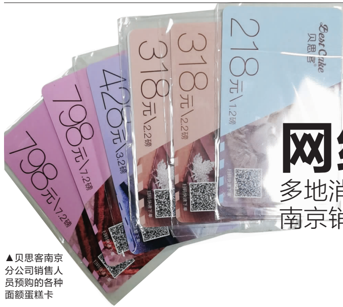
▲贝思客南京分公司销售人员预购的各种面额蛋糕卡