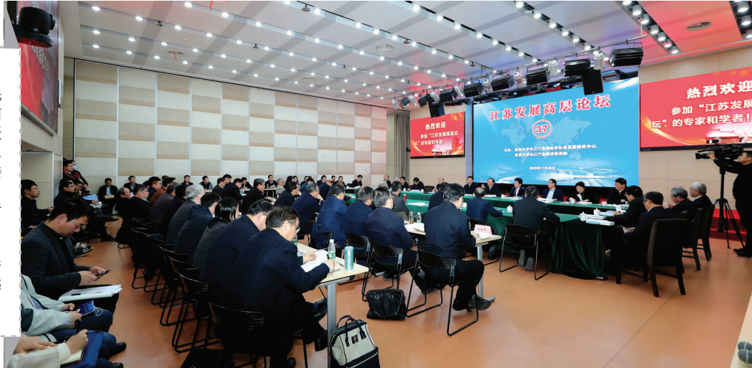
江苏发展高层论坛第37次会议在南京大学举行

11月30日,以“江苏:在率先实现社会主义现代化上走在前列”为主题的江苏发展高层论坛第37次会议在南京大学举行。省委书记、省人大常委会主任娄勤俭,省委副书记、省长吴政隆,省政协主席黄莉新到会听取专家学者意见。