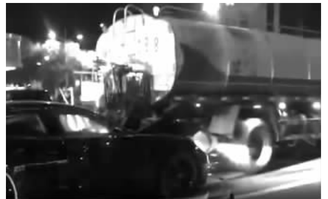
小轿车整个车头钻进槽罐车底部 视频截图

快报讯(通讯员 李缙 杨艳琪 记者 毛晓华)11月28日晚，一辆槽罐车在等红灯时，一辆小轿车从后方直接怼了上来，车头整个钻进槽罐车底部。现代快报记者获悉，轿车司机没有生命危险。