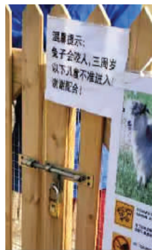
现在“乐园”已对入园孩子年龄提出要求