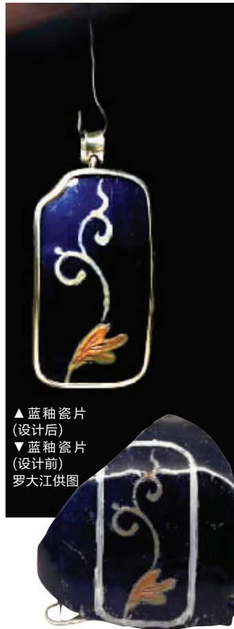
▲ 蓝釉瓷片 (设计后) ▼ 蓝釉瓷片 (设计前)

在独具慧眼的藏家眼里,即使小到一件碎瓷片,也有独具一格的美。瓷片、帽正、玉坠……来自北京的藏家罗大江的收藏中,有很多这