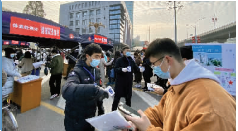
考生进入考场前须按要求测体温、出示苏康码