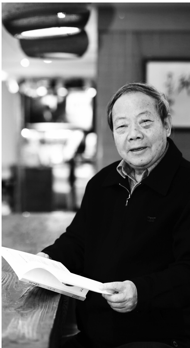
俞明接受现代快报专访

公元前115年，汉武帝刘彻派张骞第二次出使西域，到达中亚地区和乌孙等国。张骞回到长安