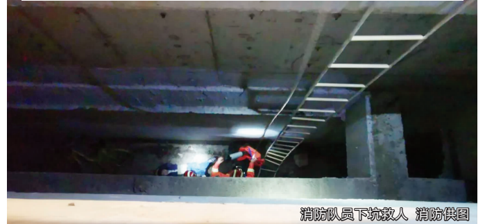
消防队员下坑救人