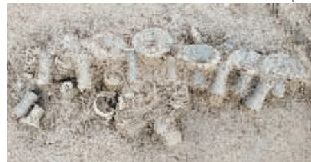
叶县余庄遗址标号为T0405的探方出土的陶器

河南省文物考古研究院院长刘海旺说,从现有的考古发现来看,余庄遗址部分“遗存”可能已进入夏代纪年。