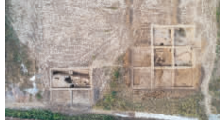
叶县余庄遗址发掘区航拍图(11月3日摄,无人机照片)