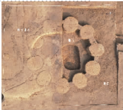
淮阳时庄遗址地上粮仓俯视图(上为北,东半部解剖发掘至活动面)

数据显示,上述遗存的年代为距今3700年到4000年左右,均已进入夏代纪年的范围。