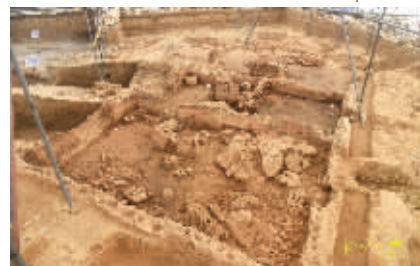
南阳黄山遗址出土的仰韶文化晚期的大型玉石器生产作坊(2020年8月摄)