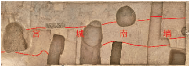
偃师二里头都城遗址宫城南墙西段平面

近日,河南偃师二里头遗址发布最新考古成果:新发现的道路和墙垣,把二里头都城分为不同的网格区域,不同家族分区而居,居葬合一,形成了中国最早的多网格式都城布局。