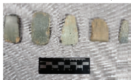
南阳黄山遗址出土的石质制玉工具——系列刻刀(2019年1月8日摄)

此次考古出土了数量丰富的钻、刻刀、磨墩等石质工具,以及玉石料残次品、陶器、骨器等遗物。“这说明黄山遗址是仰韶文化晚期和屈家岭文化时期的一个专业玉石器制造场,是具有大型玉石器生产‘基地’性质的大遗址。”