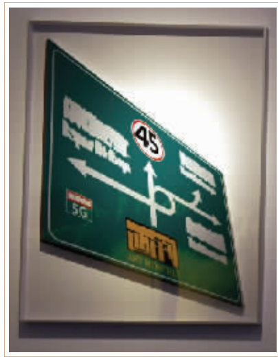
▲龚新如作品《路向何方》