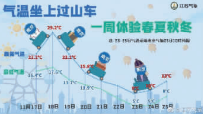
一周体验春夏秋冬