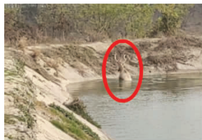
麋鹿滑进鱼塘,怎么爬也爬不上来

11月14日上午9点钟左右,盐城公安边防支队东台河闸边防派出所接到辖区居民报警称,在东台市海边的一处鱼塘里,有一只成年公麋鹿不慎滑入水中,无法爬上岸,请求派出所来人施救。