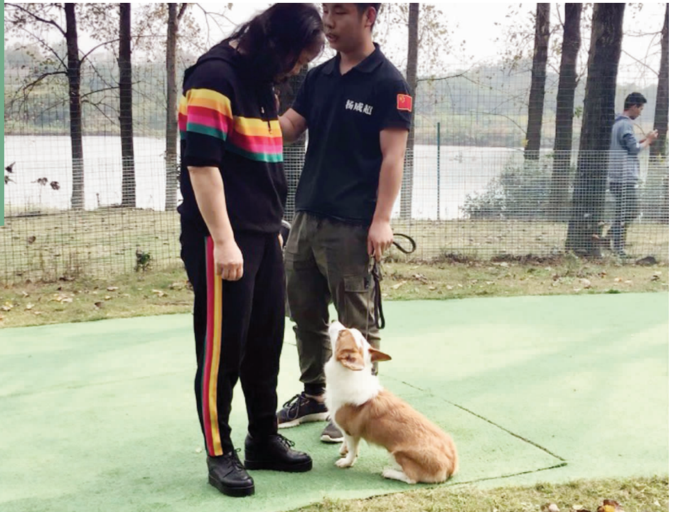
主人也要陪同训练

近日,在热播综艺《女儿们的恋爱》中,明星送自家的狗狗去上宠物学校,让人大开眼界。其实,这样的宠物学校南京也有。现代快报记者了解到,这样的学校是寄宿制,宠物要在学校中封闭学习一个月。老师们会培养宠物们各种技能,纠正拆家、护食、扑咬等坏习惯。当然,这一套学习的价格也不便宜,初级班课程要4000元左右,高级班课程要8000元。