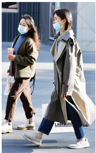
持续晴好,中午让人感觉暖洋洋

快报讯(记者 卢河燕)小“晴”歌继续播放!昨天,江苏大部分地区最高气温重回20℃。今明后三天继续复制粘贴晴好模式,需要注意的是,今天早晨最低气温较低,长江以北东部地区4℃左右,淮北地区有霜或霜冻。沿江和苏南地区8℃左右,其他地区6℃到7℃。“双十一”后,也就是11月12日起,最低气温开始小幅度回升。江苏东北部地区回升到6℃左右,苏南地区9℃到10℃,其他地区8℃左右。到了13日,沿江和苏南地区低温再次下降1℃,预计在8℃到9℃,其他地区6℃到7℃,昼夜温差大。