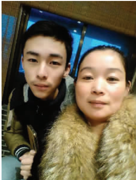
张女士生前与儿子的合影