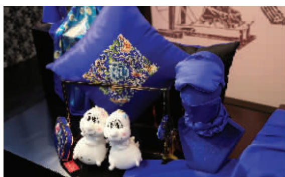
江苏展区的丝绸苏绣产品