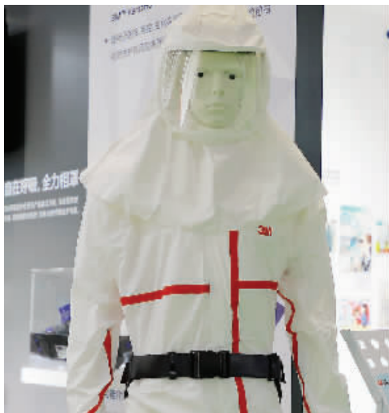
3M公司的电动送风防护服