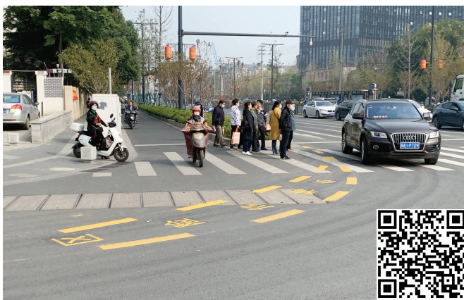
卡子门大街大明路路口新增“右转危险区” 扫码看视频