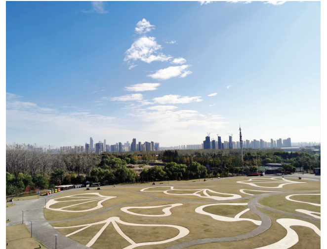
鱼嘴滨江湿地公园全景