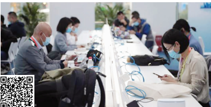
进博会新闻中心