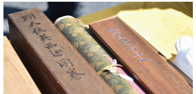
从日本入境,即将亮相第三届进博会的中国古画(11月3日摄)

上海海关4日公布,5件进境参展第三届中国国际进口博览会的文物展品,经上海海关和上海市文物局共同监管,将于5日在进博会举办场馆正式亮相,进博会由此打开一条海外中国文物回流通道。