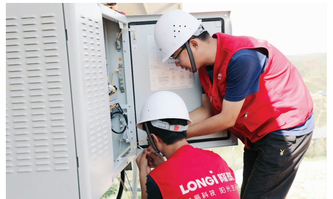
运维人员正在为光伏扶贫电站检修

位于山西东北部的广灵县裴家洼村后山地上，30兆瓦的光伏扶贫电站横跨多个山脊，宛如一条充满无限生机的长龙。这座30兆瓦的光伏扶贫电站，是中信金融租赁携手隆基股份建设的。该项目采用“光伏+扶贫+林业”的综合解决方案，在实现清洁能源输出的同时，与中药材、灌木林业相结合，形成林光互补等生态互补建设模式。项目每年将拿出180万元，通过20年的持续投入帮助600户贫困户实现彻底脱贫。