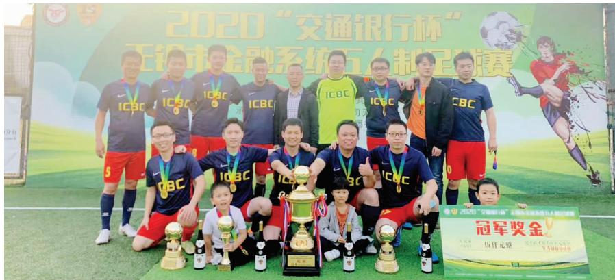
中国工商银行无锡分行勇夺市金融系统足球联赛冠军

10月25日下午，第五届无锡市金融系统足球联赛在新体育中心恒星体育足球训练基地圆满落幕。中国工商银行无锡分行足球队经过顽强拼搏，勇夺联赛冠军！