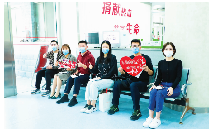
志愿者们在等候献血

10月20日，交通银行无锡分行第十三届无偿献血公益活动在市中心血站如期举行，分行共60名志愿者参加。一张张热情的笑脸，一本本鲜红的献血证，构成了今年深秋最温馨的画面。“撸起袖子加油干”不仅是前进的号角，更展现了交通银行员工的拳拳赤子情怀。今年无锡分行青年突击队更是作为无锡唯一一家金融组织荣获无锡市抗疫优秀志愿者公益服务集体。