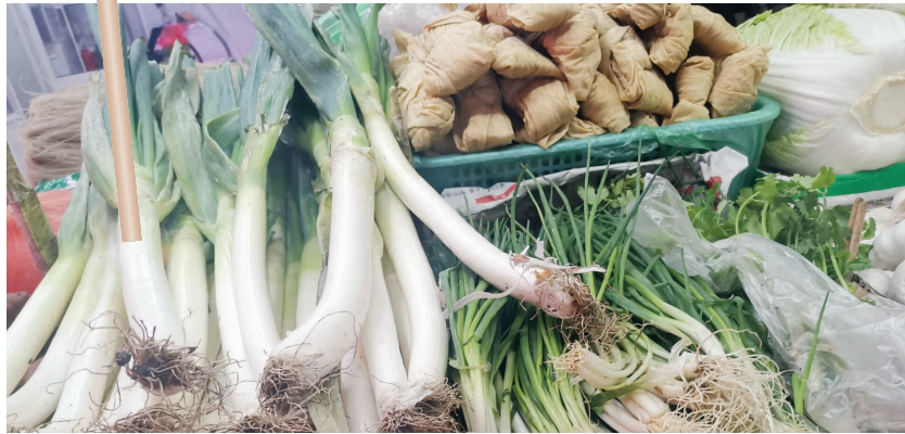
因为进价高，卖大葱的菜贩都少了