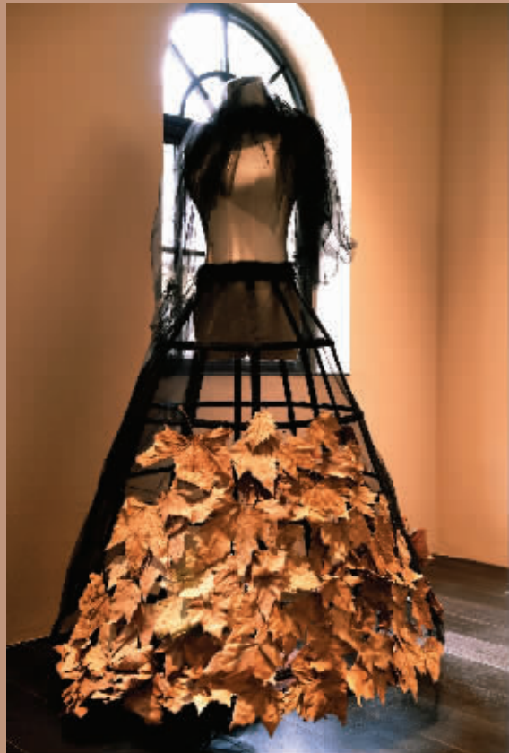
宝儿最近的旧衣改造作品