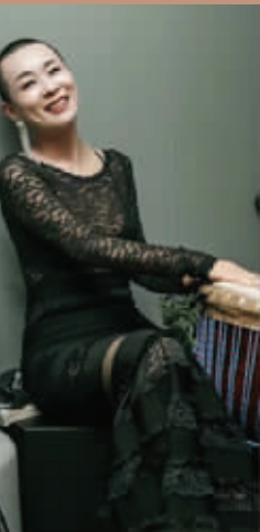
旧衣改造范例