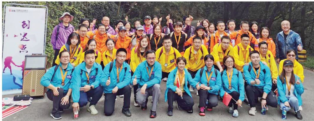
“聚力同行，志凌云巅”登山活动

10月18日，光大银行无锡分行在惠山国家森林公园举办“聚力同行，志凌云巅”登山活动，本次活动一共分为5个小组，每个小组选出10名组员参加竞速比赛。