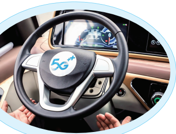
国内首个常态化运营5G无人驾驶公交落户苏州

快报讯（通讯员 徐美珠 记者 何玥頔）在苏州高铁新城，一辆轻型小巴行驶在城市开放道路上。小巴的外观色彩亮丽，安装多个扫描雷达，给乘客提供免费搭乘的服务，更重要的是，小巴的司机位置上不是驾驶员，而是一位安全员——手不碰触方向盘，脚不碰触刹车和油门。仅在特殊情况下，才会“出手”干预车辆行进——这是全国首个常态化运营5G无人驾驶公交，10月21日，中国移动5G自动驾驶峰会期间，这一无人驾驶公交正式亮相苏州，由中国移动和无人驾驶公司轻舟智航联合部署。该项目计划覆盖苏州北站周边9.8平方公里区域，解决居民出行“最后一公里”难题。