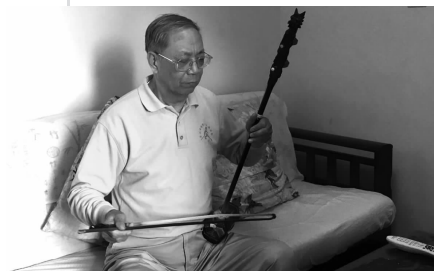
背下曲谱,一遍遍拉二胡练熟