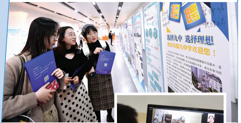
大图:招聘会现场 小图:连线外地名校毕业生