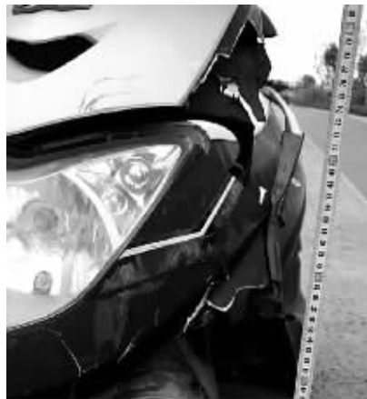
勘查现场