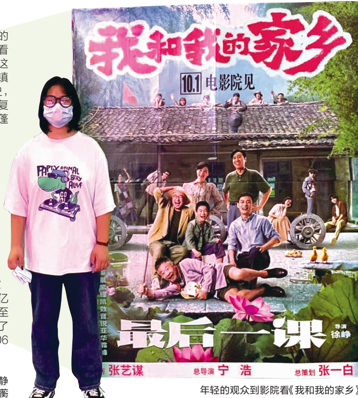
年轻的观众到影院看《我和我的家乡》